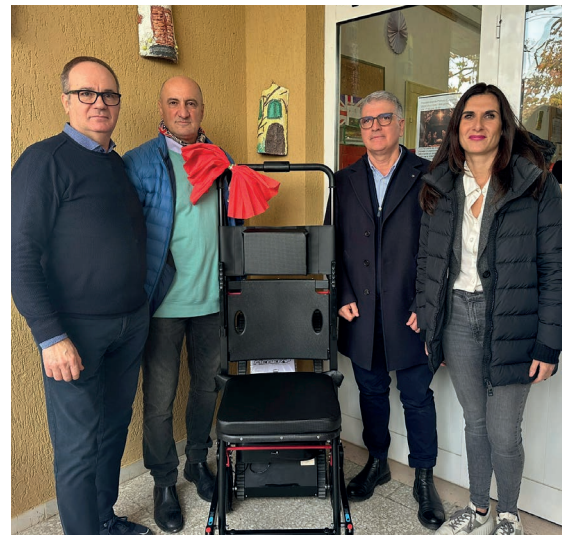
SCUOLA ACCESSIBILE A Centoia la donazione del Calcio Valdichiana, dopo l'investimento del Comune per la rampa