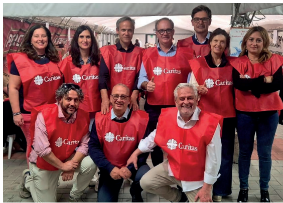
CENA SOLIDARIETÀ A Fossa del Lupo: oltre 300 a tavola in favore delle Caritas