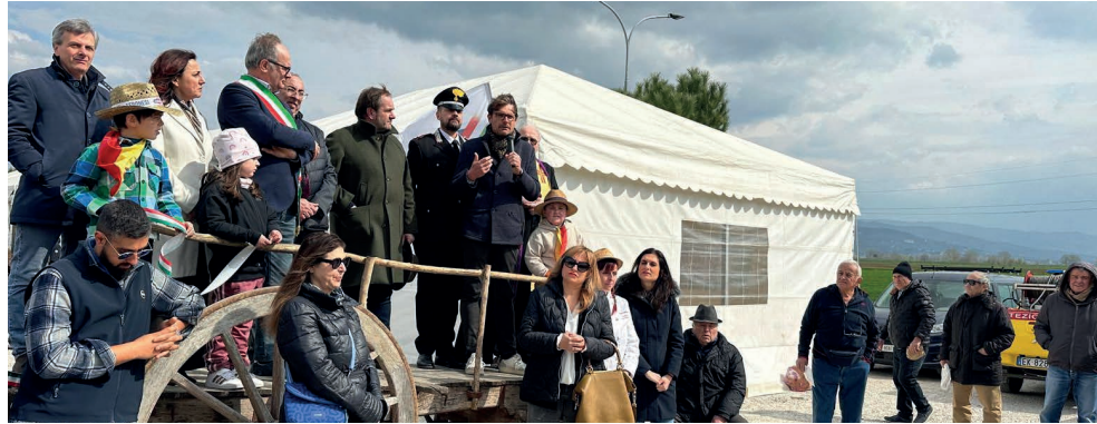
IL VITELLONE, FRATTICCIOLA Un momento dell'inaugurazione