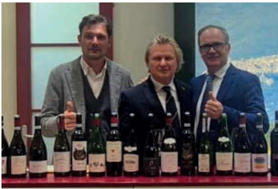
CORTONA A VINITALY Visita allo stand del Consorzio Cortona Doc e dei produttori locali