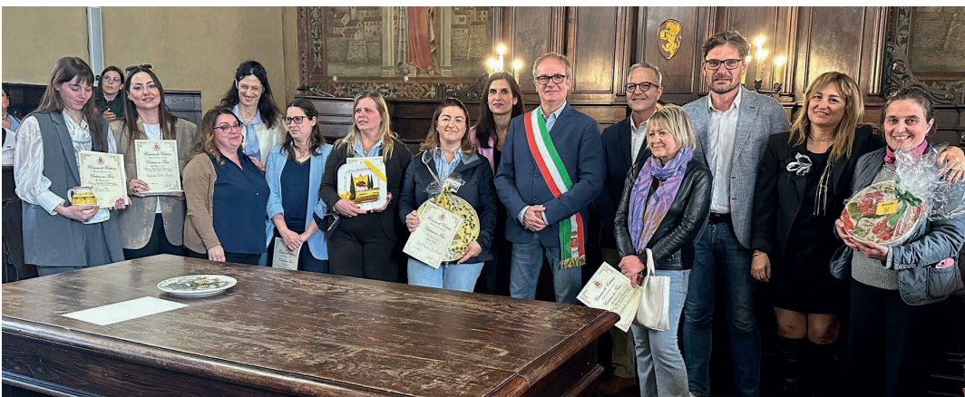
CONCORSO CORTONA IN FIORE Le installazioni più belle realizzate in centro. Premiata anche la scuola primaria Mancini