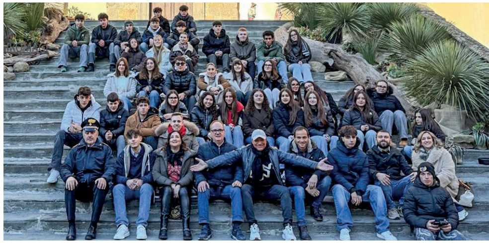
LE SCUOLE SU RAI UNO La trasmissione Uno Mattina in famiglia ha ospitato gli alunni degli istituti Cortona 1 e Signorelli