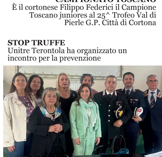
STOP TRUFFE Unire Terontola ha organizzato un incontro per la prevenzione