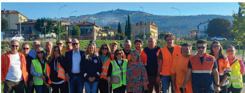
Passeggiando insieme, volontariato ambientale a Camucia 21 settembre 2024