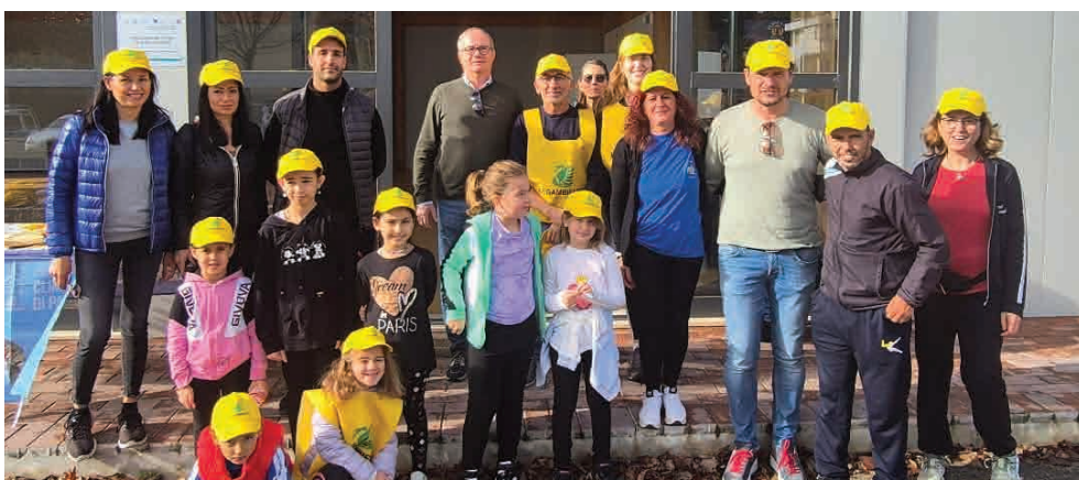
Puliamo il mondo, Mercatale 20 ottobre 2024