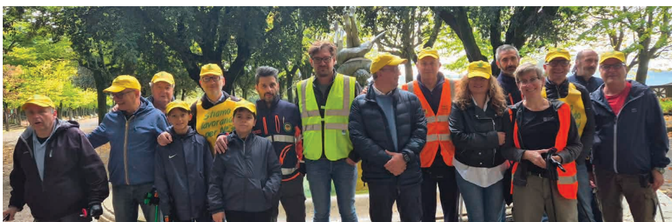
Puliamo il mondo, Giardini parterre Cortona 20 ottobre 2024